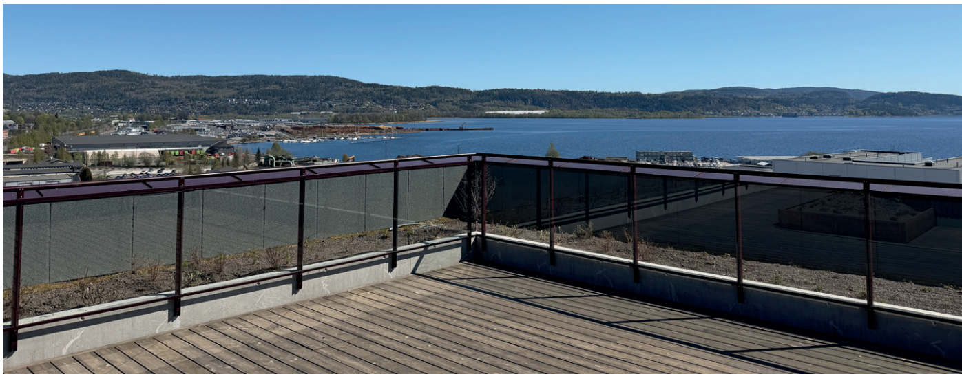
Det er vidstrakt utsikt fra takterrassen i Trekkeriet.