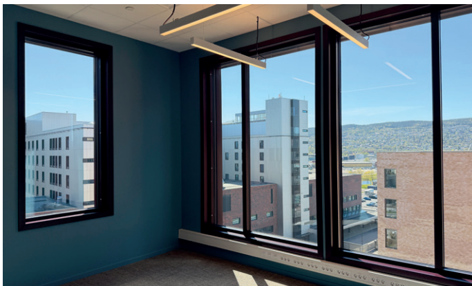
Byggene er åtte og ni etasjer i høyden.