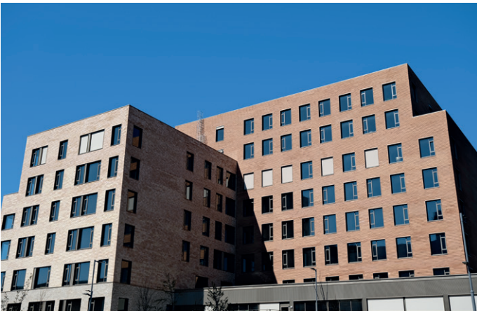
Thon Hotell Drammen skal etter planen åpne dørene i juni.