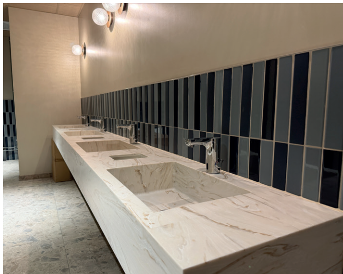
Målet er at helseparken skal bli et godt tilskudd til det nye sykehuset på andre siden av gaten.