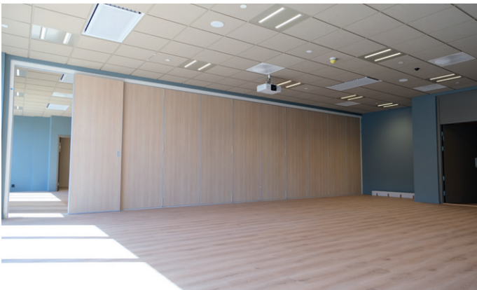
Strøm Gundersen skal også bygge byggetrinn to i Drammen Helsepark.