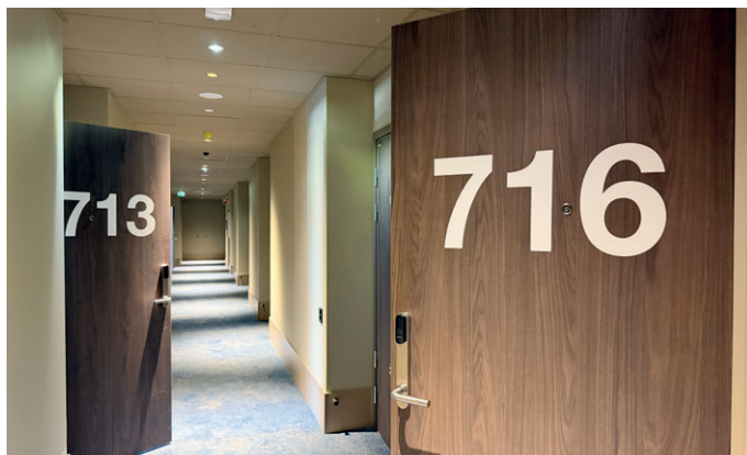
Hotellet blir et av Drammens største.

BubbleDeck, rådgivende ingeniør i byggeteknikk (RIB).