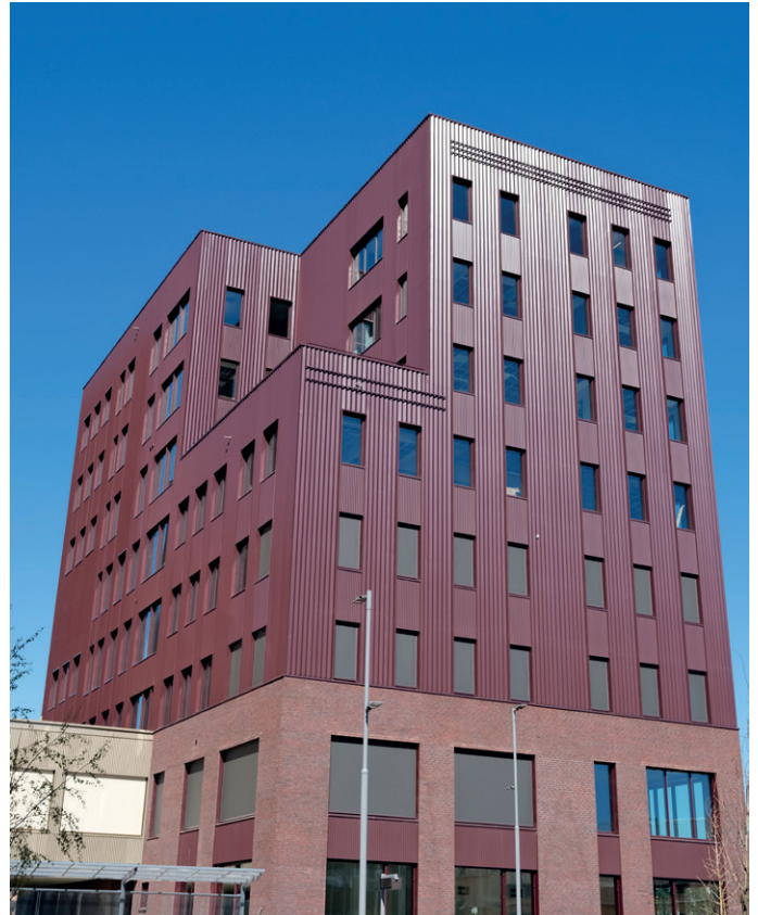
Det nye næringsbygget har fått navnet Trekkeriet, oppkalt etter tidligere virksomhet på Brakerøya.

– Dette er noe av det bedre vi har levert. Vi er veldig stolte, og synes det er gøy å levere et så fint tilskudd til Drammen. Det er viktig for oss, for selskapet har en nær tilknytning til byen. Vi har tidligere bidratt i utbyggingen av Kinokvartalet, Union Brygge og Papirbredden, og er veldig glade for å få være med på å prege Drammen, sier han.