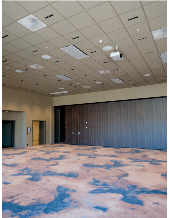
Det er store konferansearealer i det nye hotellet.