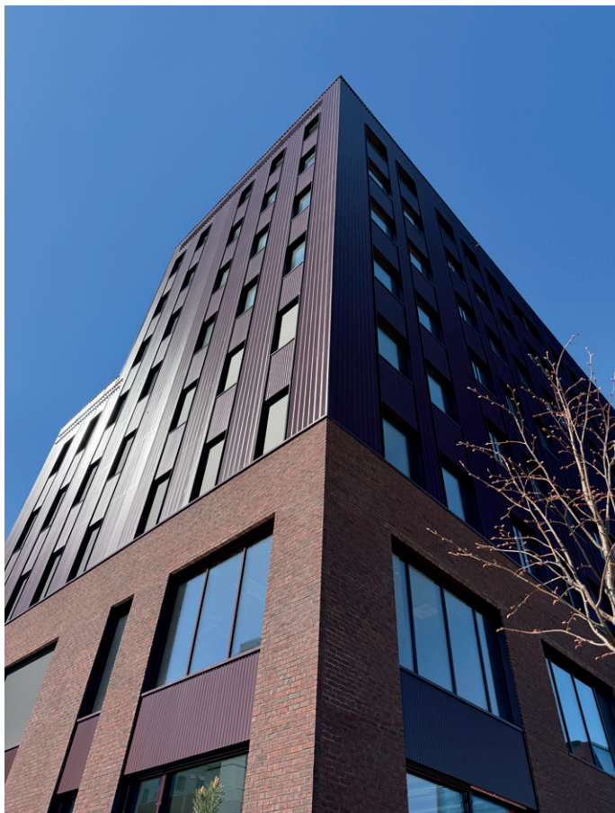
Lokalene i næringsbygget er allerede utleid.