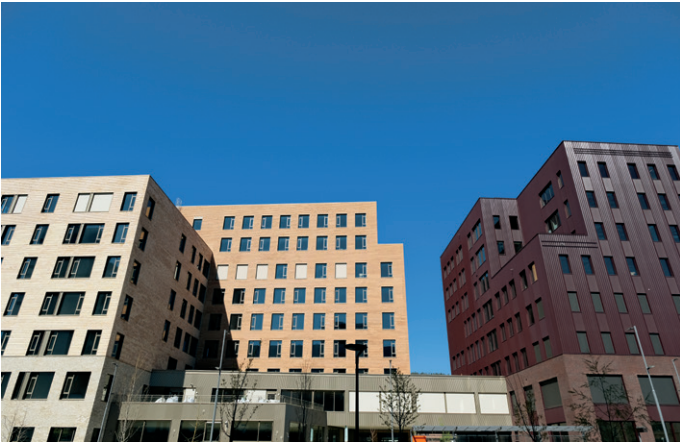
Første byggetrinn i Drammen Helsepark er på rundt 17.500 kvadratmeter.