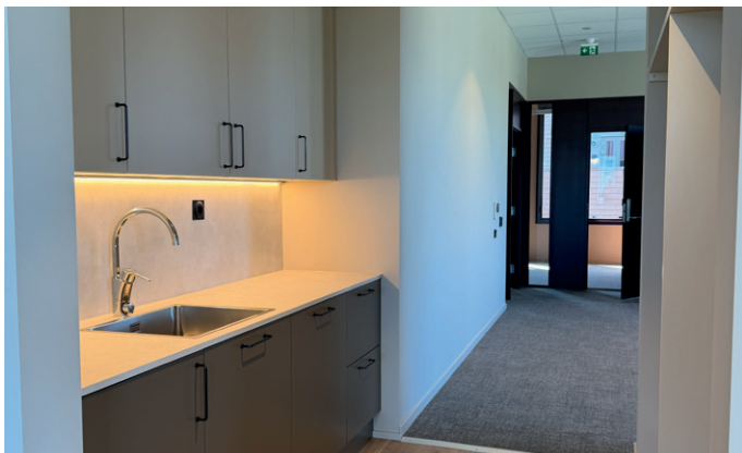
Kjøkkenkrok i næringsbygget.