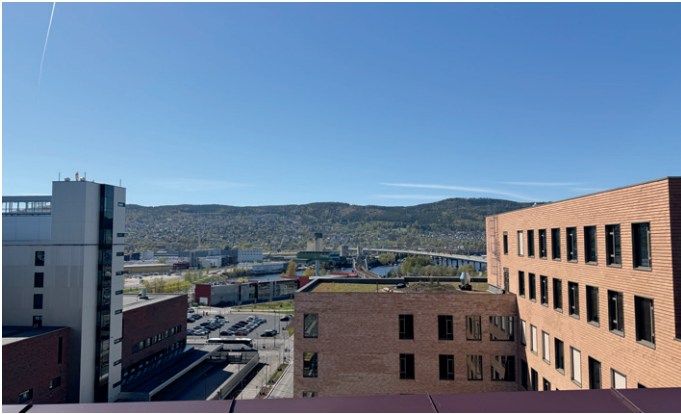
De to første av i alt sju bygg i Drammen Helsepark er nå ferdige.