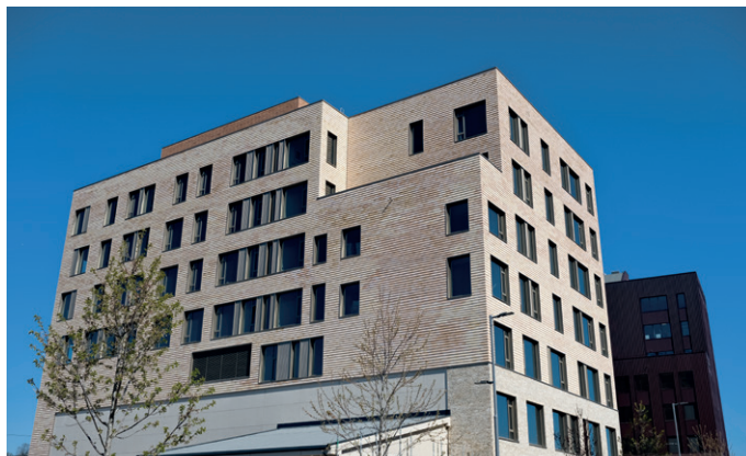
Det er brukt tegl, skjermtegl og metallplater på fasaden.