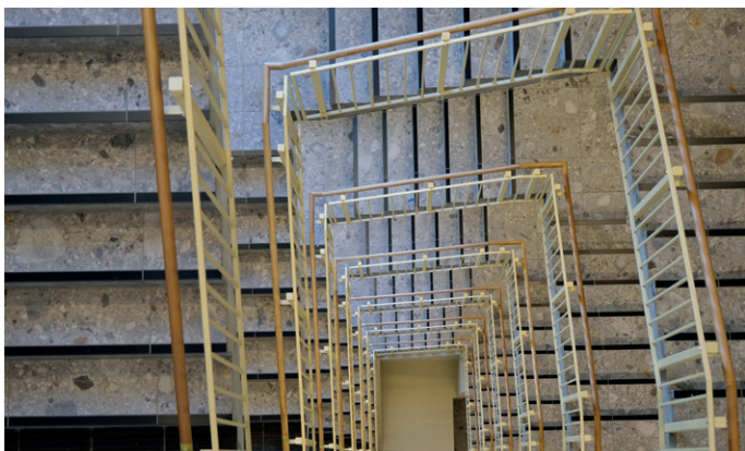
Byggene skal oppnå sertifiseringen BREEAM Excellent.