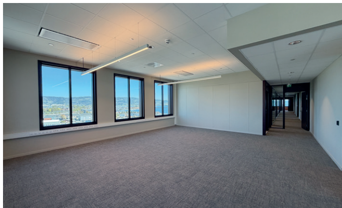
Det skal i hovedsak flytte inn helserelatert virksomhet i det nye næringsbygget.